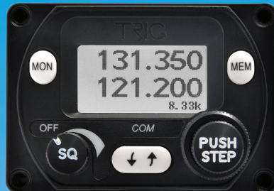
8.33 Radio – P1

Voler en duo? Deux têtes valent mieux qu'une!