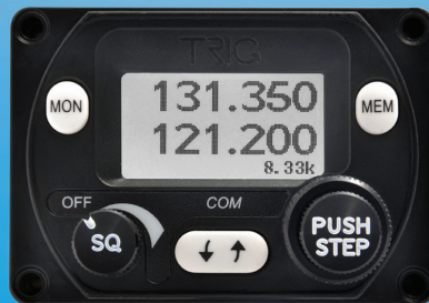
8.33 Radio – P2

Les radios TRIG sont maintenant disponibles avec deux contrôleurs.