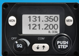
8.33 Radio – P1

Voler en duo? Deux têtes valent mieux qu'une!