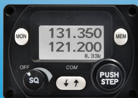
8.33 Radio – P2

Les radios TRIG sont disponibles avec deux contrôleurs.