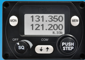
8.33 Radio – P1

Fliegen Sie Tandem? Zwei Bedienköpfe sind besser!